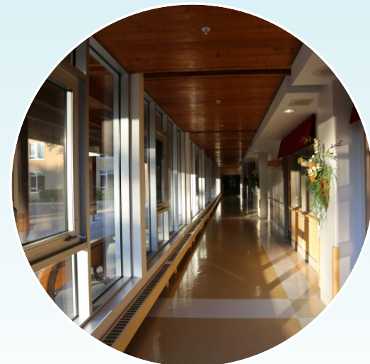
CHSLD RÉSIDENCE RIVIERA, QC, CANADA