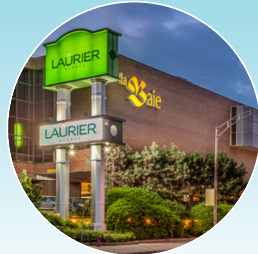
PLACE LAURIER, QUÉBEC, QC, CANADA